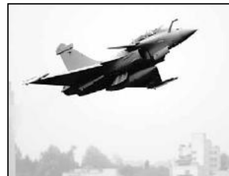
A plein gaz, le Rafale atteint 108 décibels.

A plein gaz, l'Eurofighter atteint 110 db, le Rafale 108 et le Gripen 105. Le F/A-18 se situe à 107 et le Tiger à 100. Il faut une différence d'au moins 3 db à une oreille humaine pour distinguer deux événements séparés dans le temps. Une différence de 10 db correspond à un doublement de l'intensité du bruit perçu. ATS